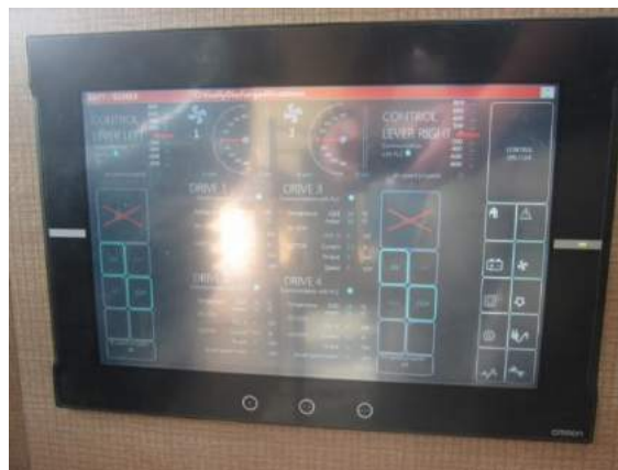
駕駛室與輪機室的機電設備人機介面