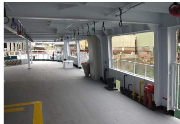
旗福一號各甲板空間實照