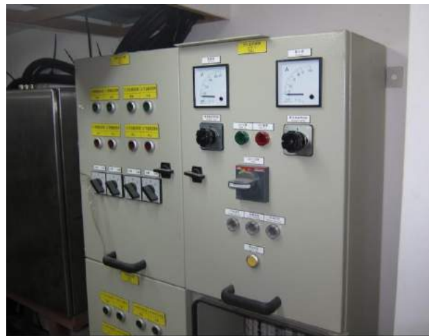
船上配電盤照片，左圖右側黃色設備為直流漏電裝置