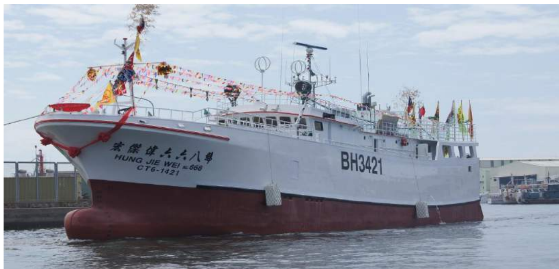
宏傑偉 668 號外觀

船上採用美式或日式自動投繩機系統，除了配有 1 個預冷室外另有 4 個凍結艙(可達零下 55 度)，全船設有 7 個漁艙，滿載時可以容納漁貨 200 噸。機艙相當寬廣，方便人員在機艙中工作；機器裝備也能較有規律的擺放，讓整個艙間看起來整齊、乾淨。船長、輪機長、漁業觀察員有獨立房間，船員室設有 25 個睡鋪，並且裝置冷氣機。並利用引擎排氣熱設置烘衣室，讓船員有乾爽的衣服換洗。